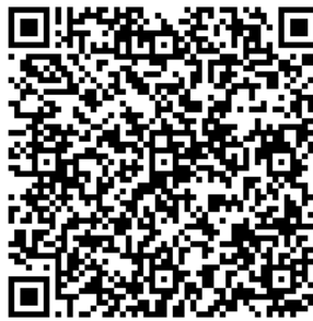
Рисунок 7 — Сценарий тематической викторины с примерами вопросов

В каждом из перечисленных мероприятий важно отслеживать активность участников, высказываемыми ими мнения, их настрой в целом. На таких мероприятиях необходимо присутствие психолога для фиксации активности и оценки их поведения.