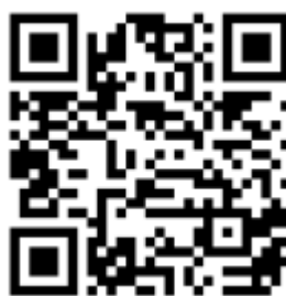
Рисунок 6 — Рекомендации по проведению кинопоказов в профилактике

Среди фильмов по тематике противодействия терроризму можно использовать следующие фильмы: «Беслан. Память» (Россия, 2014 г., возрастное ограничение: 12+), «Кавказский пленник» (Россия, 1996 г., возрастное ограничение: 18+), «Я не террорист» (Узбекистан, 2021 г., возрастное ограничение: 18+), «Отель Мумбаи: противостояние» (США, Австралия, 2018 г., возрастное ограничение: 18+) и т.д.